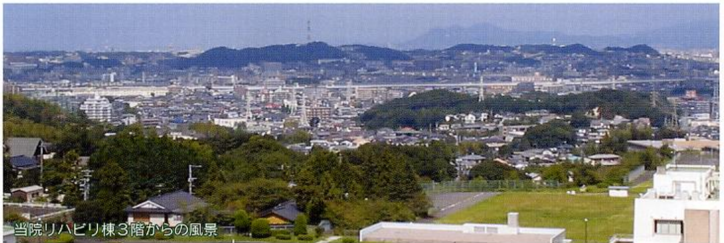
当院リハビリ棟3階からの風景

〒811-1355 福岡市南区大字松原853-9 TEL 092-566-7061代 FAX 092-566-7065 (医療相談地域連携室)566-7205