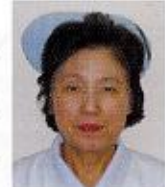
夫婦石病院 総師長