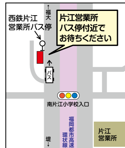
片江営業所バス停